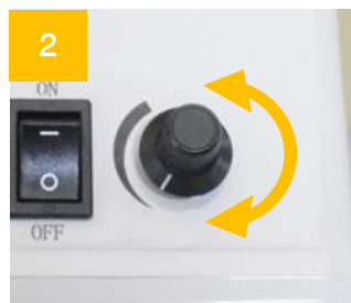
2 用途に合わせて吐出量を調整します。