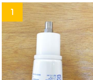
1 潤滑剤に専用キャップを取り付けます