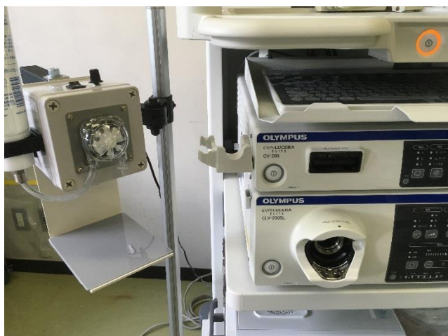
内視鏡トロリーへ取り付けます。

✓ 使用機器に直接設置できる省スペース設計で、検査室を圧迫することはありません。