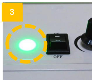
3 電源 ON するとランプが緑色に点灯します。