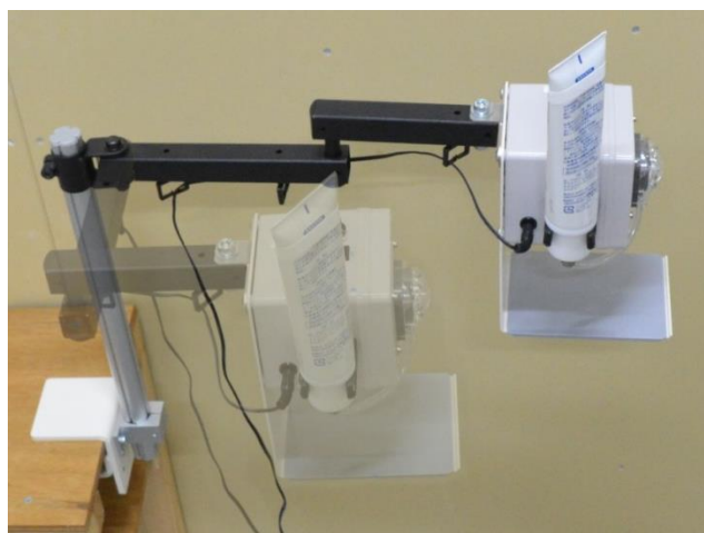
2軸アームで細かな位置設定が可能です。